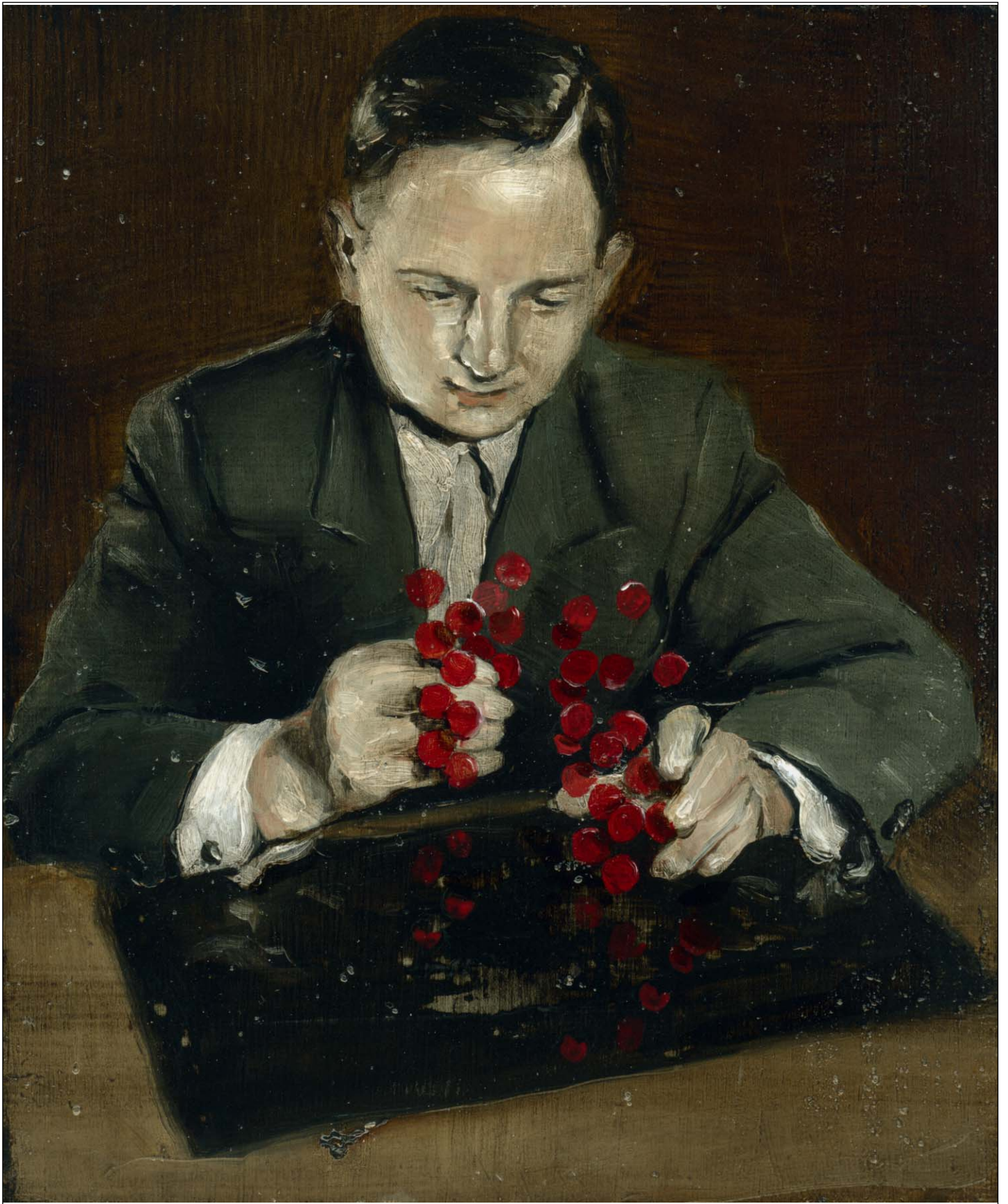
Michael Borremans kortárs festő műve.