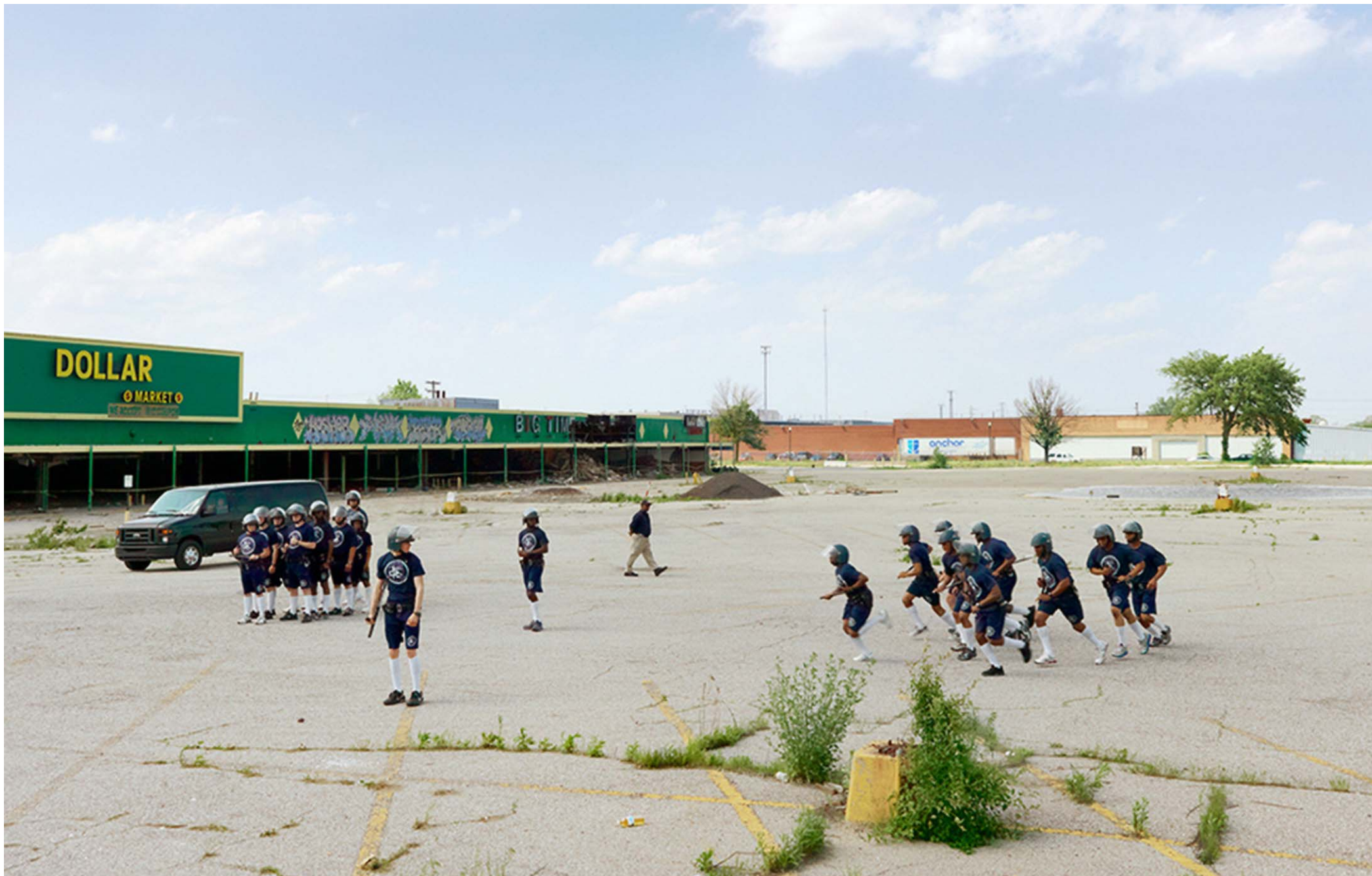
Fotó: Rendőrök gyakorlatoznak Detroit lepusztult vidékein